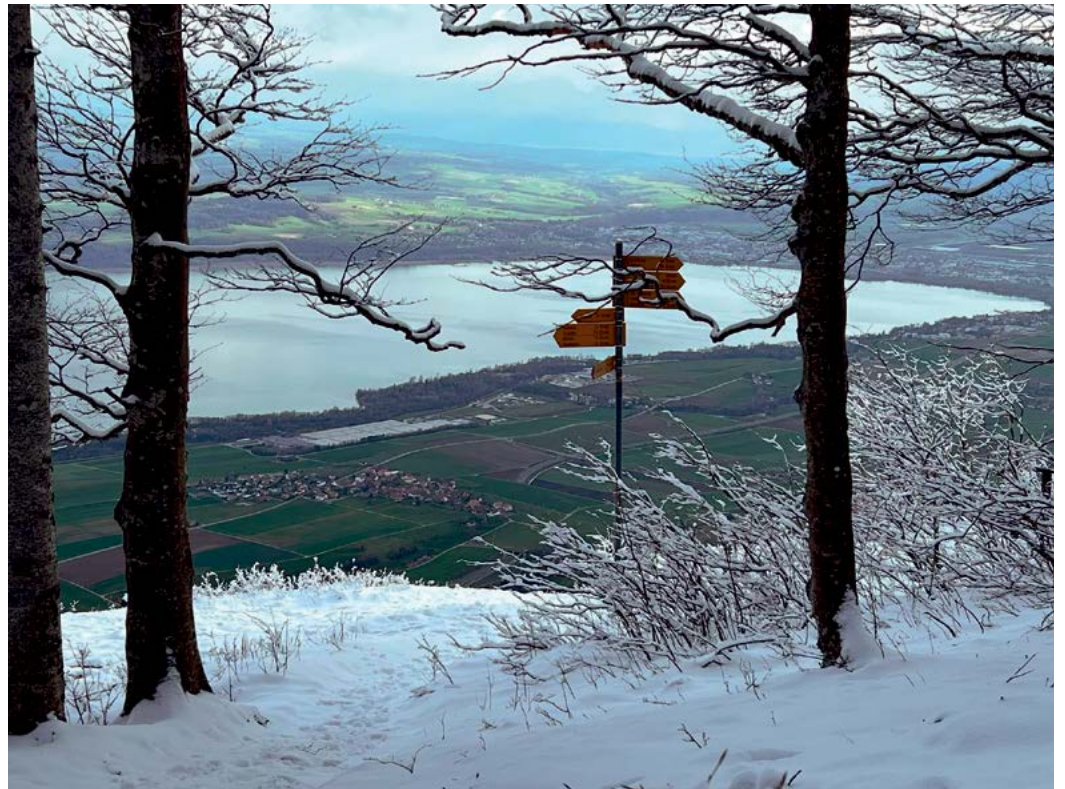
Vue depuis le Mont-Aubert.