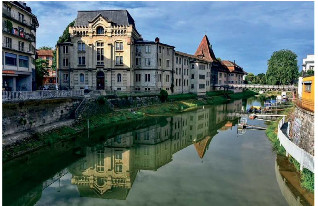
Refllet d'Yverdon sur la Thièle.

En longeant les sentiers du bord du lac, le visiteur arrive sur une place où se dressent 45 pierres datant du néolithique, les célèbres menhirs de