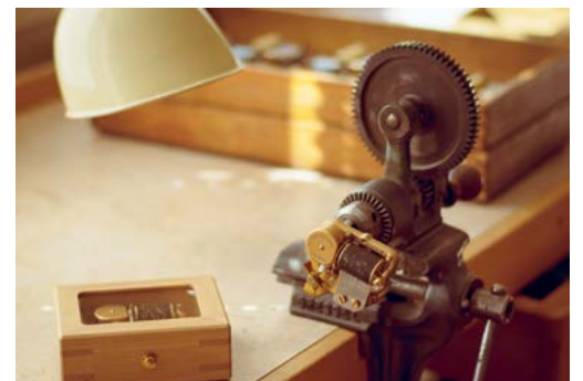
Boîte à musique.

Grandson est un joli bourg médiéval où il est bon de se perdre dans les ruelles se situant entre le château et le temple Saint-Jean-Baptiste, tous les deux monuments restaurés ou agrandis au XI V ème siècle par Othon 1 er , seigneur de Grandson.