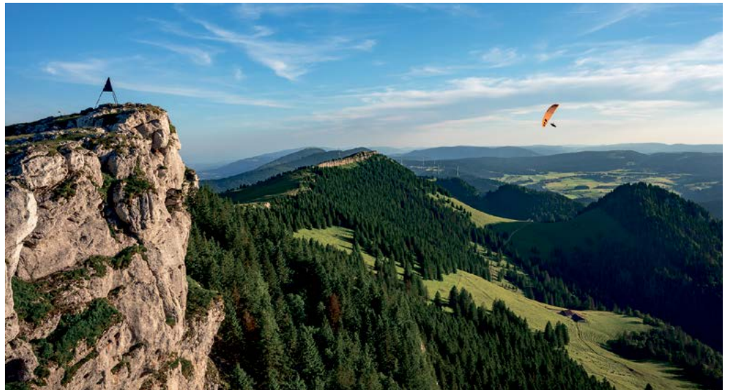
Vol vespéral au Chasseron.

Actuellement trois communes constituent ce petit bijou de région avec Le Chenit, Le Lieu et L'Abbaye qui n'en formeront plus qu'une seule au 1er janvier 2027. Il existe également sept fractions de communes qui sont Le Pont, L'Abbaye, Les Bioux, L'Orient, Le Brassus, Le Sentier et Le Séchey.