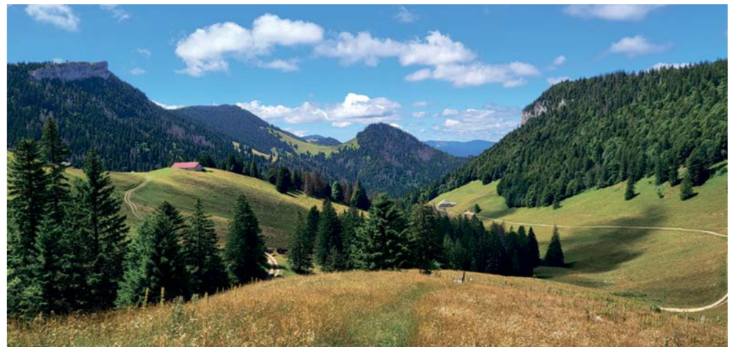
Vallon de la Dénériaz