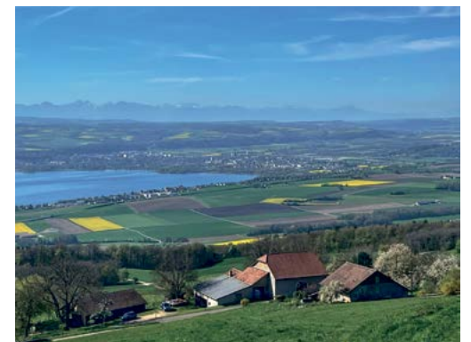
Vue sur la plaine.

Cette deuxième ville du canton a un tissu économique important avec plus de 2'000 entreprises. Ce qui n'était guère le cas au milieu du vingtième siècle où, en 1969, des acteurs politiques et économiques de la région fondent l'ADNV dans le but de diversifier l'économie. L'Association du Nord Vaudois organise des événements, pour tous les publics, afin d'animer l'activité socio-économique de la région et faire profiter le nord vaudois des retombées économiques. Des projets sont également créés afin de générer des emplois.