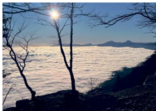
Plaine et mer de brouillard.

Yverdon est rebaptisé Yverdon-les-Bains, en 1981, afin de rendre hommage à sa source thermale connue déjà à l'antiquité. Cette cité a toujours été une véritable île, bordée par le lac, par plusieurs cours d'eaux et canaux (Mujon, Thièle, Oriental et Buron), ainsi que par un marécage. Son centre thermal est composé de la source thermale sulfurée (29°), mais impossible de savoir depuis quand le thermalisme s'est développé. Le culte des sources est implanté depuis le 1 er siècle après J.-C., donc cela reste une région très active depuis plus de 4000 ans.