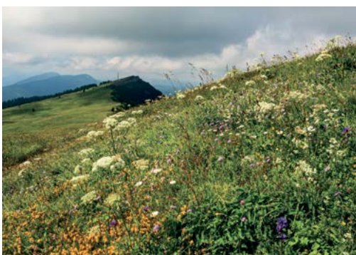
Prairie au Chasseron.

De nombreuses balades et parcours à vélo cheminent sur les sentiers allant du lac au sommet du Jura, permettant de découvrir maintes surprises agréables comme le dolmen à Onnens, le sommet du Chasseron, la paisible balade le long de l'Arnon ou la descente de Ste-Croix à Vuiteboeuf par les gorges de Covatannaz. Pour la saison hivernale, de nombreux kilomètres de pistes de ski de fond, de raquettes et même, une belle petite station de ski de pistes aux Rasses, proposent des activités pour tous. Et pour la remise en forme après toutes ces découvertes, une Blue zone, centre de santé pour le corps et l'esprit, a ouvert ses portes récemment à Champagne.