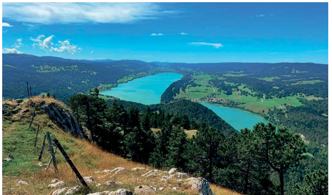
Lac de Joux.

A la Vallée, une vingtaine de manufactures horlogères réputées sont implantées. Le savoir-faire des Combiens (le nom des habitants de la Vallée de Joux) et leur maîtrise des techniques horlogères de pointe, que l'on appelle « complications », ont attiré de très grandes marques. En 1833, le premier atelier de la Manufacture Jaegger-Lecoultre est créé dans la région, suivi, en 1875, par Audemars Piguet qui s'installe au Brassus. Breguet, l'une des plus anciennes marques de montres encore en activité, s'est installée plus tardivement dans la région, mais cette manufacture est une pionnière dans les complications, notamment avec sa célèbre réalisation du tourbillon (mécanisme qui améliore la précision des montres mécaniques).