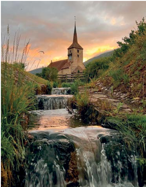
Eglise de Concise.

Toujours à Yverdon-les-Bains, il y a un très grand pôle de formation, puisque plus de 10'000 étudiants et apprentis se forment à la Haute Ecole d'Ingénierie et de Gestion du canton de Vaud (HEIG-VD), au Centre professionnel du Nord vaudois (CPNV), au centre de formation des métiers de mécanique (YMECA) et à l'école supérieure du domaine social (ARPIH).