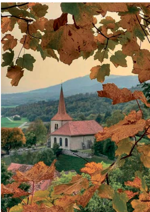
Eglise de Baulmes.

De nombreux loisirs font de la ville d'Yverdon-les-Bains un lieu de villégiature agréable. Du point de vue culturel, plusieurs théâtres, galeries et cinémas offrent un panel de possibilités; la Maison d'Ailleurs, musée de la science-fiction qui fêtera ses 50 ans le premier week-end de mai, permet de voyager à travers utopies et voyages extraordinaires.