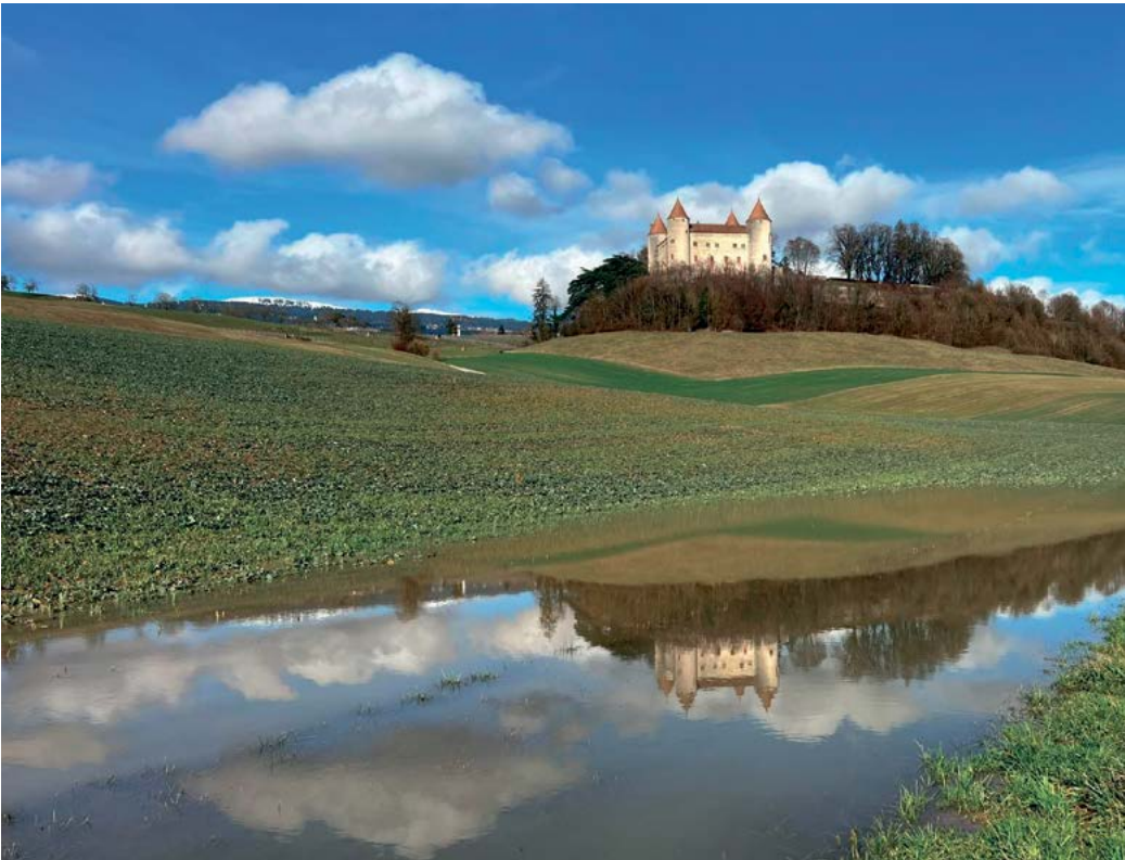
Château de Champvent.